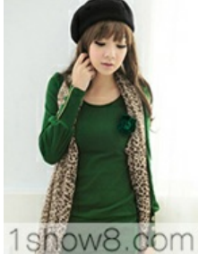
1show8.com Q-1693 %KEÑBàhÉpCÙ :÷200C 200 C 6ĭ | -p